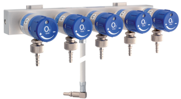
Multistar 5. Block med fem flödesväljare.