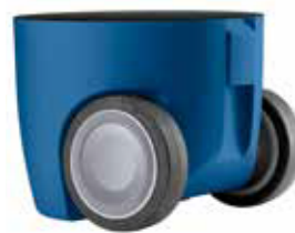
GENIE® balona ratiņi.

Balona ratiņi izmantojami jebkura izmēra GENIE® balonam. Balons vienkārši ieslīd rata elementā un jānostiprina, izmantojot divas diametrāli pretējas spīļu spaiļes.