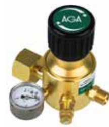
Regulatora veids PRO

Produkta numurs: Argons/MISON® 333914 Slāpekļis 333915