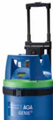
GENIE® teleskopiskais rokturis.

Rokturis ērti lietojams kopā ar GENIE® balona pārvietošanas ierīci uz rītenītiem. Pagarinājumu var vienkārši piespraust GENIE® balona rokturim, un izvilkt nepieciešamajā garumā.