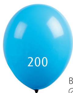
Ballon latex Ø 35 cm