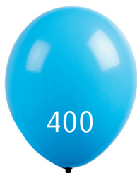
Ballon latex Ø 25 cm