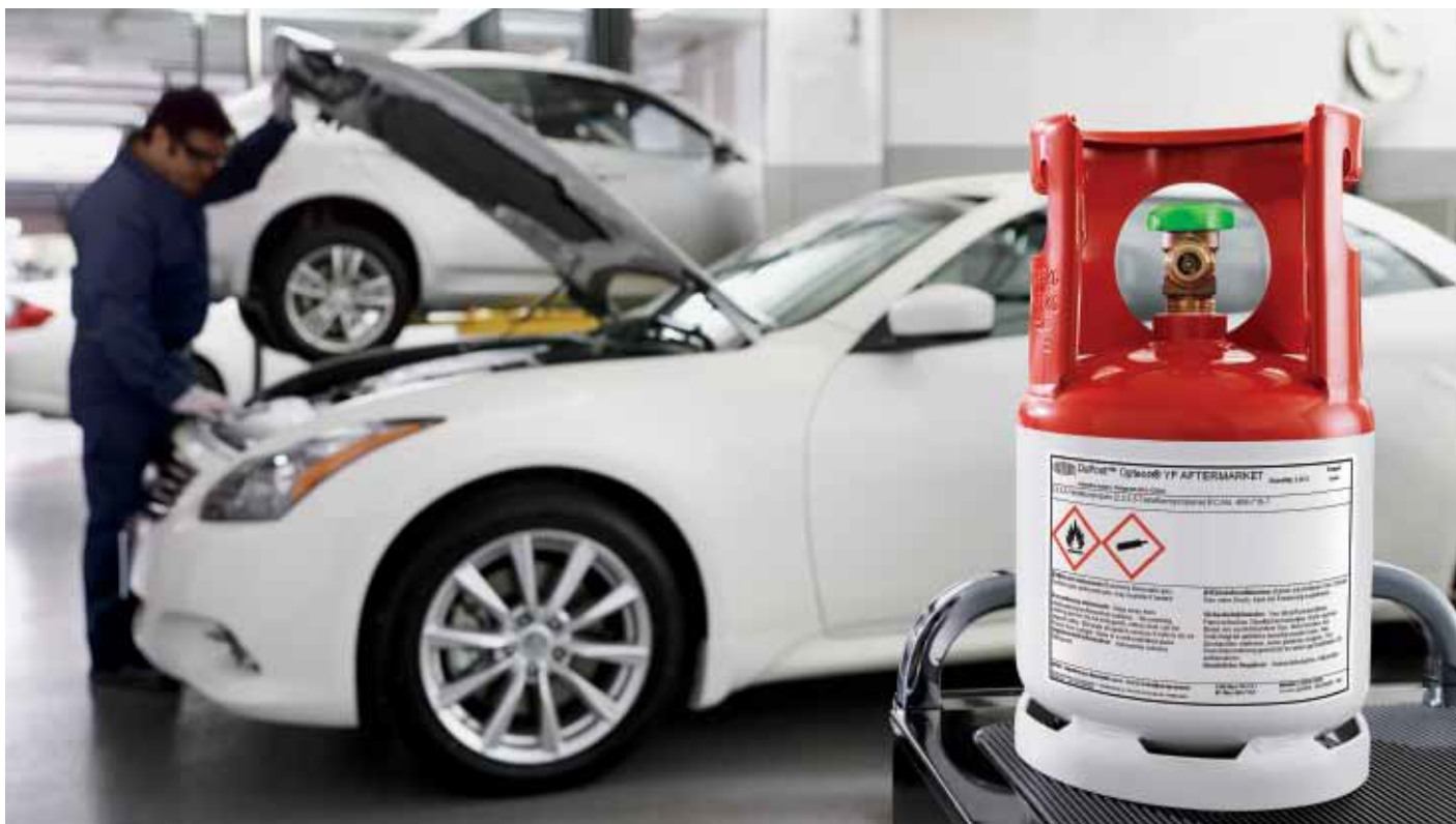
Valokuvan käyttö tapahtuu E.I. du Pont de Nemours -yhtiön luvalla.