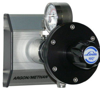
W 20/0,1 0,1 bar