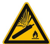
Signaux de danger