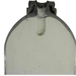
Schnitt einer C 2 H 2 -Flasche

Trotz des oben erwähnten Sicherheitssystems kann es unter ungünstigen Umständen zu einer Zerfallsreaktion im Flascheninnern kommen.