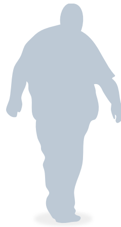
Benjamin, 36 Jahre

Wählen Sie aus den verschiedenen Spirometriesystemen, dem Basis-Spirometer Vyntus® SPIRO, dem erweiterbaren Vyntus® PNEUMO oder unserem Impulsoszillometrie-System Vyntus® IOS.