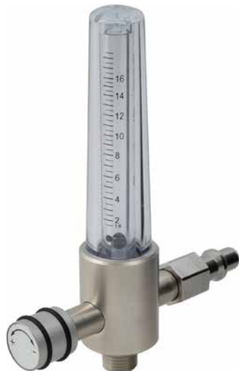
Exécution simple O 2