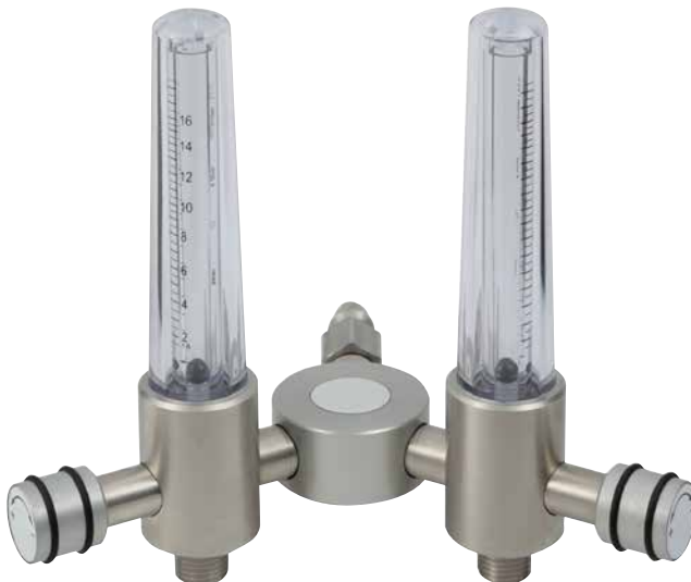
Exécution double O 2