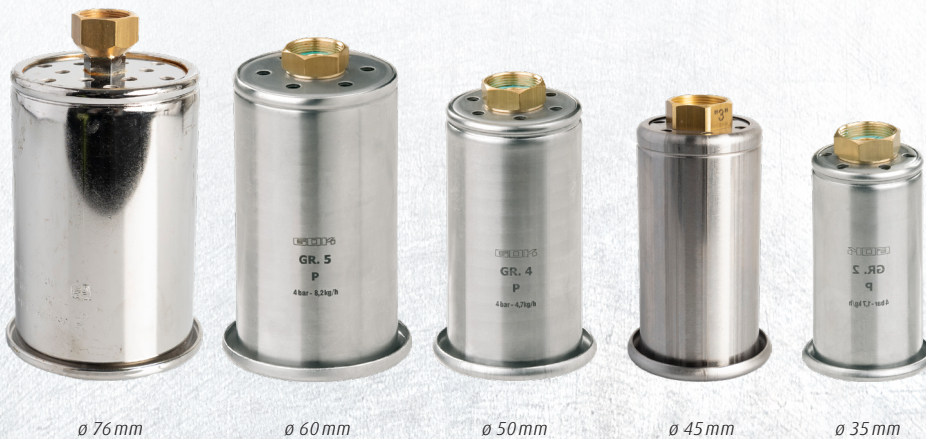
ø 76 mm