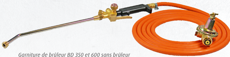
Garniture de brûleur BD 350 et 600 sans brûleur