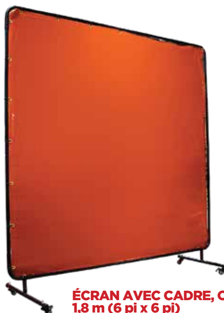
ÉCRAN AVEC CADRE, ORNAGE, 1,8 m x 1,8 m (6 pi x 6 pi)

Protection modérée contre les rayons UV et IR avec une transparence optimale. Conçu pour les tâches d'intensité faible à modérée (p. ex. meulage, ébavurage et soudage léger).