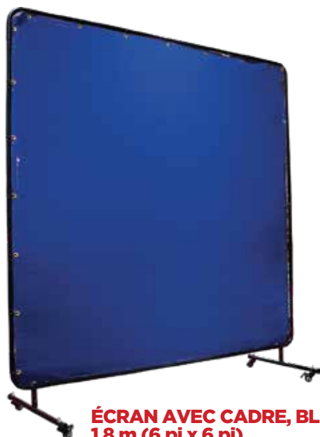
ÉCRAN AVEC CADRE, BLEU, 1,8 m x 1,8 m (6 pi x 6 pi)

Protège contre les rayons UV et IR, les étincelles et l'éblouissement durant le soudage, le coupage et le brasage. Offre une protection intense et idéale lors du soudage TIG et MIG, ainsi que lors du soudage à l'arc avec électrode enrobée.