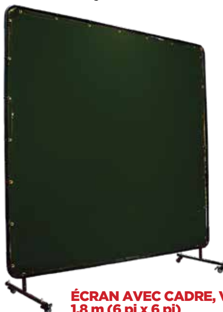
ÉCRAN AVEC CADRE, VERT, 1,8 m x 1,8 m (6 pi x 6 pi)

Conçu pour le coupage au chalumeau, le soudage au gaz et le soudage MIG. Offre une forte protection contre les rayons UV et IR lors de soudage à haute fréquence.